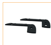
401-027-B Bouchon d'extrémité