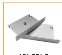
404-004-B Bouchon d'extrémité