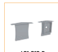
401-010-B Bouchon d'extrémité