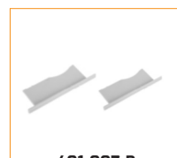
401-007-B Bouchon d'extrémité