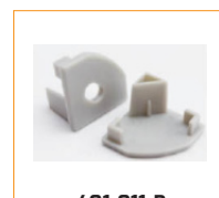
401-011-B Bouchon d'extrémité