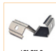
401-011-C Clip de fixation