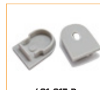
401-017-B Bouchon d'extrémité