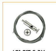
401-017-S-2M Suspente câble