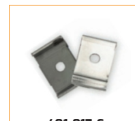
401-017-C Clips de fixation