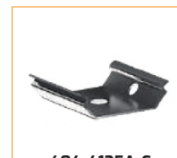
404-4135A-C Clip de fixation