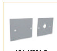
404-4135A-B Bouchon d'extrémité