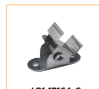
401-1716A-C Clip de fixation