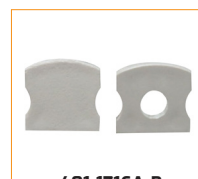
401-1716A-B Bouchon d'extrémité