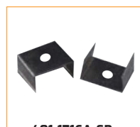
401-1716A-SR Support orientable