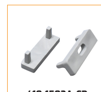
410-1502A-CP Clip de fixation plastique