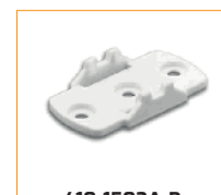
410-1502A-B Bouchon d'extrémité