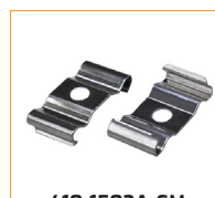
410-1502A-CM Clip de fixation métal